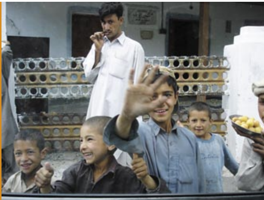
MYLDER: Glade barn og yrende folkeliv i Pakistan.

gå en kort tur videre oppover. Noen litauere som startet før oss, måtte snu etter bare 100 meter på grunn av høydesyke og tapet av en ryggsekk. Vi var på nytt først i løypa og la opp faste tau til like under 7000 meter. Vi sov to netter på 6500 meter og returnerte til base camp slitne, men fulle av pågangsmot og tro på suksess. En lengre periode med dårlig vær satte inn og vi ble værende over en uke i base camp. Det var snart gått en måned siden vi forlot Laila Peak. Fullmånen som snart nærmet seg, slo følge med det gode været nok en gang.