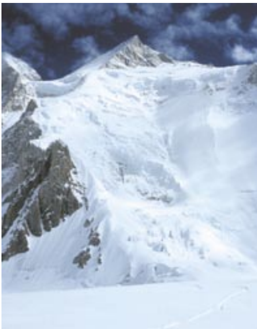
RUTA: Veien opp mot Gasherbrum2 gikk via ryggen til venstre på bildet, foran og rundt på baksiden av topptriangelet. Nedfarten gikk i brefallet til høyre.