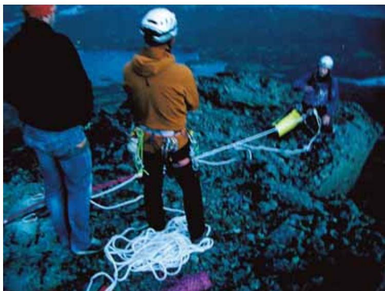
BERGING: Jørgen Aamot på veg ned til fire klatrarar som sit fast under toppen av Skogshorn.